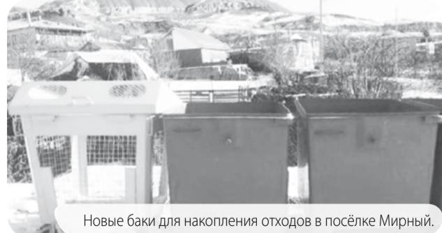
Новые баки для накопления отходов в посёлке Мирный.

В Предгорный округ прибыли новые контейнеры для раздельного накопления отходов. Солнечно-жёлтые, сетчатые, каждый готов вместить целый кубометр полезного вторсырья для переработки.