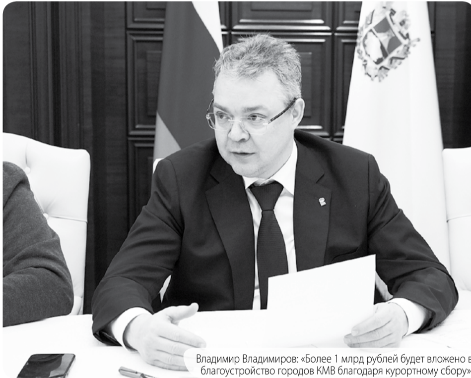
Владимир Владимиров: «Более 1 млрд рублей будет вложено в благоустройство городов КМВ благодаря курортному сбору».

Глава Ставрополья поручил краевому минтуризма обеспечить максимально эффективную проработку проектов,