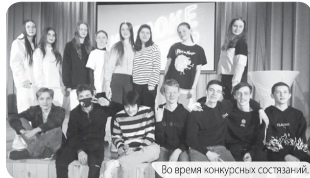
Во время конкурсных состязаний.